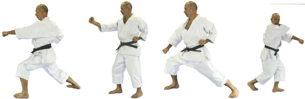
⑤ „Go“ Oi-Zuki

(alle Stellungen der Kata ohne Zusatz sind Zenkutsu-Dachi)