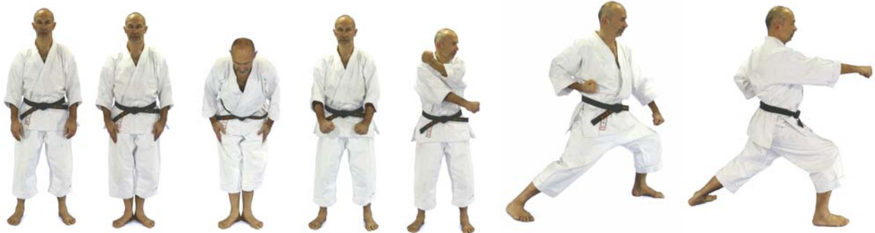
Auszgangs- Stellung (➔ Leserichtung) ➔➔➔