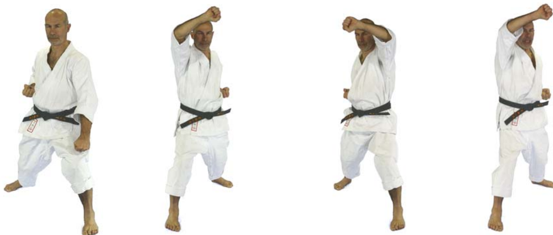
⑥ „Rokk(u)“ Gedan Barai